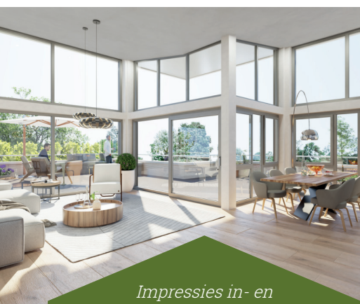
Impressies in- en exterieur Reuver Staete